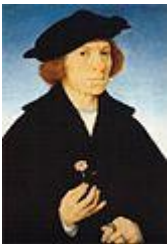
Joos van Cleve - zelfportret

Antwerpen was in die tijd het belangrijkste internationale centrum van handel, kunst en cultuur. De stad bereikte een grote bloei in de kunst en werd een van de meest actieve en snelst groeiende steden in Europa. Men noemde haar wel de wereldstad van het westen . De Canarische eilanden en ook Madeira waren belangrijke handelsplaatsen op de maritieme routes naar de rest van de wereld. De teelt en de handel in suikerriet zorgden voor grote rijkdom op de eilanden. Antwerpen werd het middelpunt van de suikerhandel. Met het transport van suikerproducten kwam ook een culturele uitwisseling tussen Vlaanderen en de Canarische Eilanden op gang. Door inwoners van de Canarische eilanden werden vele (eigentijdse) belangrijke kunststukken van kunstenaars uit Vlaanderen aangekocht. Daarom zijn er op de musea en in kloosters nog steeds een veel kunst van grote kwaliteit te zien, zoals schilderijen, altaarstukken en beeldhouwwerken. En is ook een duidelijke invloed van de Vlaamse kunst op de lokale kunstenaars van de Canarische eilanden en Madeira aanwijsbaar.